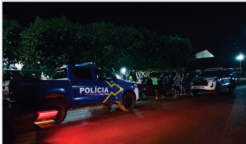
Após o ataque, o suspeito fugiu do local utilizando uma bicicleta, seguindo em direção ao loteamento Esplanada.

Após o ataque, o suspeito fugiu do local utilizando uma bicicleta