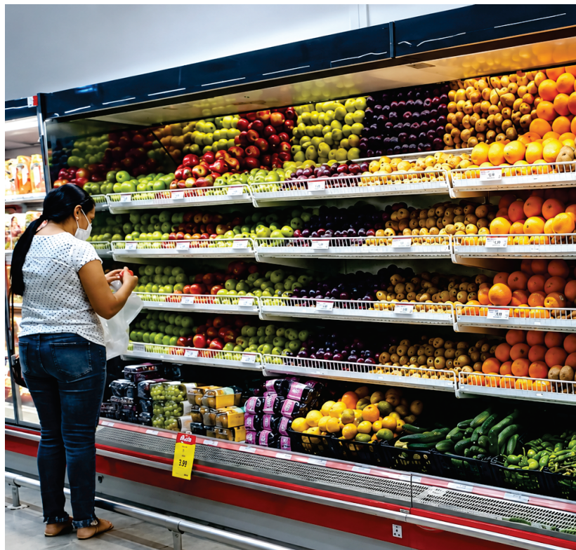
Inflação afeta poder de compra de itens básicos pelos brasileiros.

Alta foi de 0,58% no IPCA, contribuiu com acúmulo de 3,20% neste ano eleitoral de 2026 e de 4,72% nos últimos doze meses