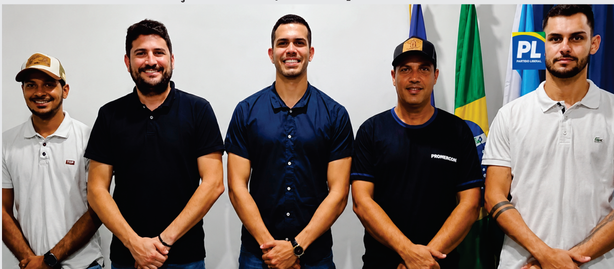
Recurso destinado por deputado estadual já foi repassado à prefeitura e será utilizado na revitalização da unidade de saúde

Recurso destinado por deputado estadual já foi repassado à prefeitura e será utilizado na revitalização da unidade de saúde, considerada referência para atendimento da população local