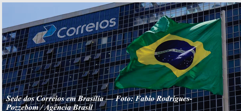
Sede dos Correios em Brasília

Estatal fecha 2025 com perdas de R$ 8,5 bilhões e recorre a empréstimos com garantia da União para cobrir despesas