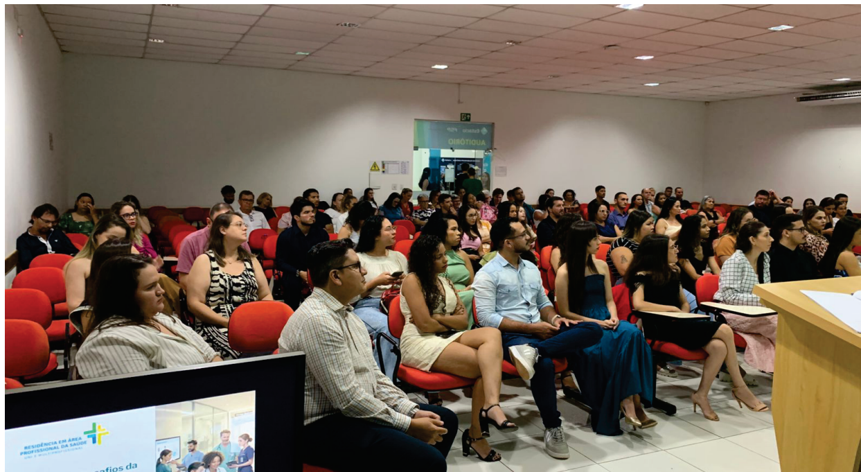
A turma de concluintes recebeu o título de especialistas em Saúde da Família após cumprir todas as etapas acadêmicas e assistenciais do programa.

Residência em Saúde forma especialistas e inicia nova etapa de qualificação profissional em Rolim de Moura. A Secretaria Municipal de Saúde de Rolim de Moura realizou, na última quinta-feira (05), na Faculdade Estácio, a solenidade de conclusão da primeira turma do Programa de Residência Multiprofissional em Atenção Básica/Saúde da Família. O evento também marcou a recepção de novos residentes e o lançamento do Programa de Residência Uniprofissional em Enfermagem Obstétrica.